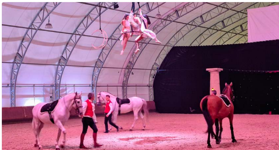
Crenay, le 14 mai. C'était la première représentation de "Pégase, les sabots du vent" aux Ecuries du Cray.

Après deux représentations jeudi et hier, l'association sportive du Cray donne sa dernière date ce soir à 20 h, à Crenay, près de Chaumont. Le thème : "Pégase, les sabots du vent". La troupe du Ménéil Saint-Michel multiplie les figures avec, sur scène, huit chevaux et autant de cavaliers. Cette année, l'originalité est d'avoir mêlé des numéros acrobatiques aériens aux prouesses équestres. Il est possible de réserver en ligne sur lesecuriesducray.fr , par téléphone au 06.84.64.58.67 ou sur place. Buvette et restauration accessible dès 18 h.