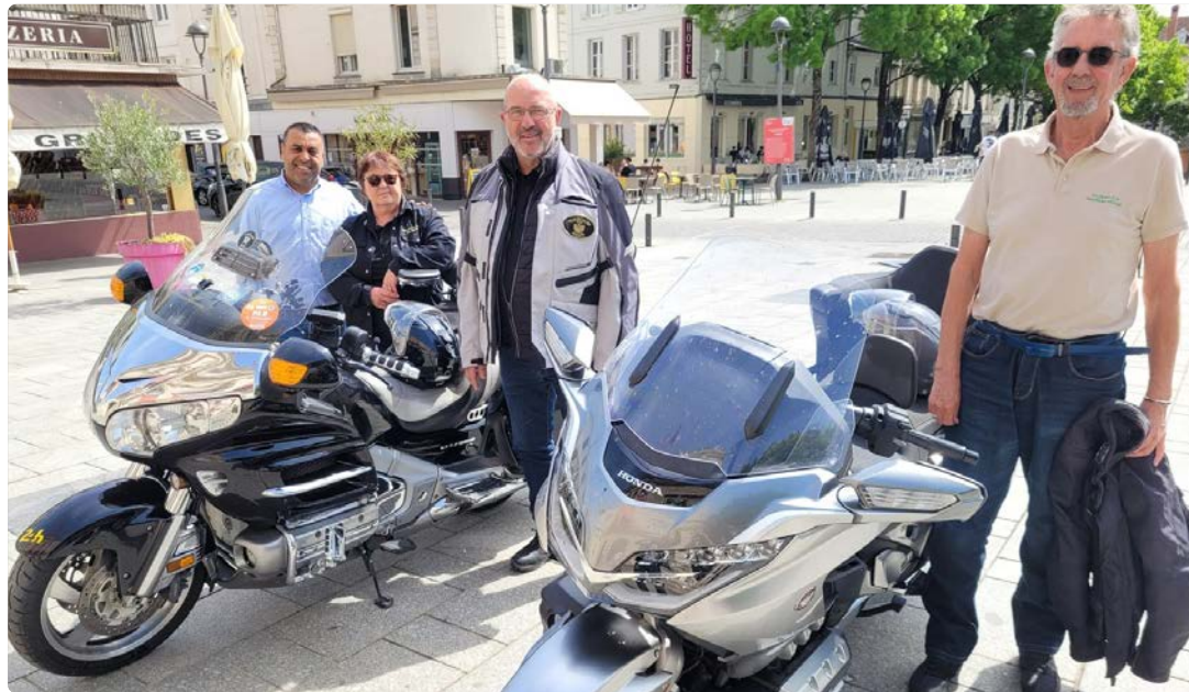
Le 27 avril, plusieurs membres du Goldwing Club de France étaient présents à Saint-Dizier pour annoncer le rassemblement d'aujourd'hui. (Photo Nicolas Frisé).

En marge du 46 e rassemblement international de motos Goldwing, du 14 au 17 mai, à Châlons-en-Champagne, entre 700 et 900 motos Goldwing sont attendues aujourd'hui, au parc du Jard, à Saint-Dizier. Surnommée "la moto des papis", la Honda deux places tout confort est devenue mythique, au point d'avoir son propre club de fans. Chaque année, à l'Ascension, le Goldwing Club de France organise un grand rassemblement, et la tradition veut qu'une déambulation conduise les participants dans une ville voisine. Nul doute qu'avec leur moteur 1 800 cm 3 de 6 cylindres, elles ne passeront pas inaperçues en arrivant, en milieu de matinée, de la route de Trois-Fontaines. Jusqu'à 16 h, elles seront exposées au Jard. Plusieurs food-trucks seront présents et un concert est prévu dans l'après-midi. Entrée gratuite.