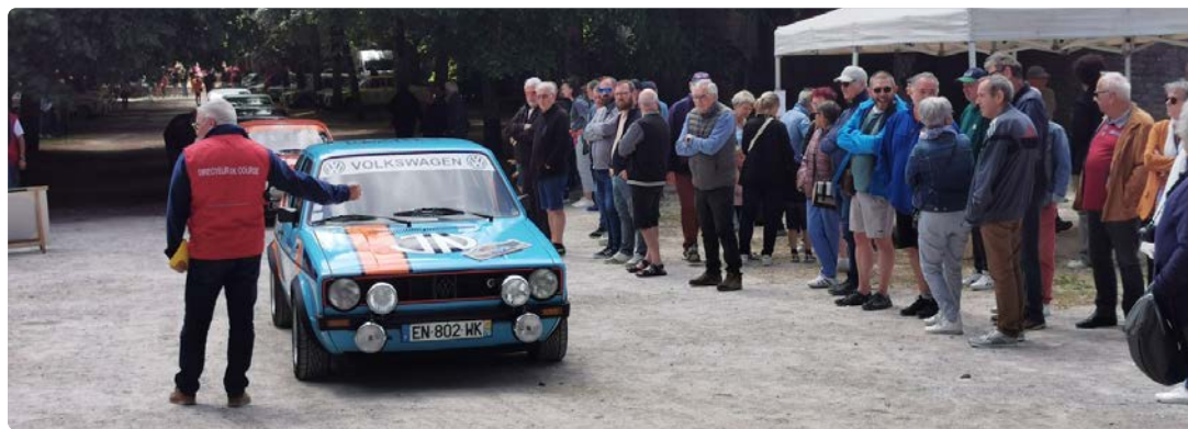
Les passionnés d'automobile pourront admirer les véhicules, allée Blanchefontaine à Langres.

Pour la 18 e édition mais les 20 ans de l'épreuve, ce ne sont pas moins de 100 équipages qui seront au départ, ce week-end à Langres, du rallye historique de la Ronde des Lingons. et de ses deux temps forts : l'épreuve de régularité et la balade. Les passionnés d'automobile et de sport mécanique auront donc le plaisir de retrouver les voitures historiques au départ de l'épreuve de régularité, ce samedi, auxquelles se grefferont celles de la balade, ce dimanche avec, pour les deux épreuves, un départ depuis l'allée Blanchefontaine à Langres. Comme de tradition, le public pourra déambuler dans l'allée pour profiter des voitures et échanger avec les pilotes avant le départ, qui sera donné à 14 h. Le parcours de régularité mènera les concurrents le samedi vers Fayl-Billot puis à Bourbonne-les-Bains pour le repas. Les participants partiront ensuite à 21 h 30 pour re-